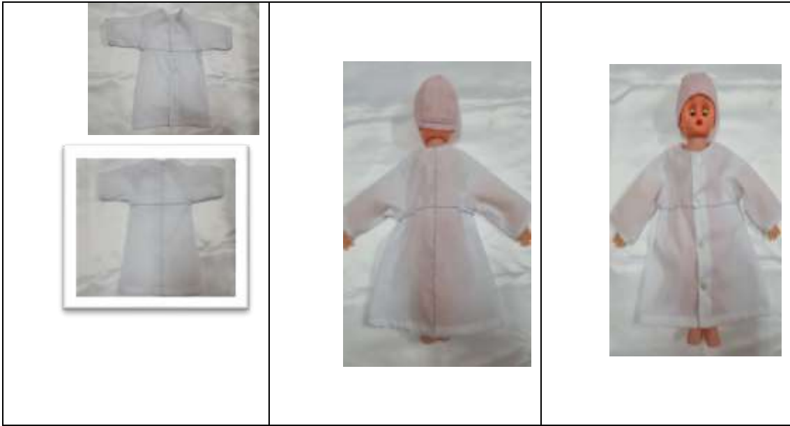
صورة رقم (2) ثوب النوم بعد التنفيذ